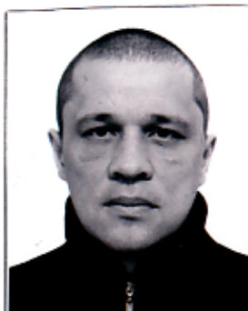
Место для фотографии